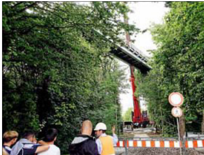
Die 30 Meter lange Brücke schwebt in luftiger Höhe

Spektakulär war die Einbringung der Behelfsbrücke über der Glems am letzten Donnerstag. Viele Schaulustige ließen sich dieses Ereignis, live dabei zu sein, nicht nehmen. Ein Koloss von 46 Tonnen Fahrbahnlänge und 30 Metern Gesamtlänge wird nun für ein Jahr über der bisherigen Fußgängerbrücke zwischen Festhalle und Bahnhofstraße befestigt sein.