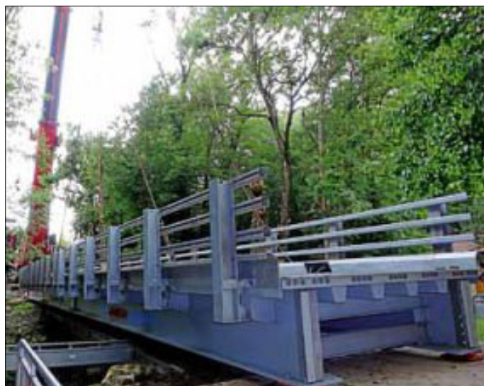
Die neue Behelfsbrücke über der Glems

Bereits in den frühen Morgenstunden am Donnerstag wurden dazu zwei Teile an Brückenelementen aus dem nordrhein-westfälischen Emmerich am Rhein angeliefert. Auch ein 500 Tonnen schwerer Kran war dabei.